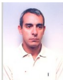
Foto Oficial do Responsável pela relação com os Concorrentes