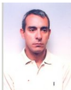
Foto Oficial do Responsável pela relação com os Concorrentes